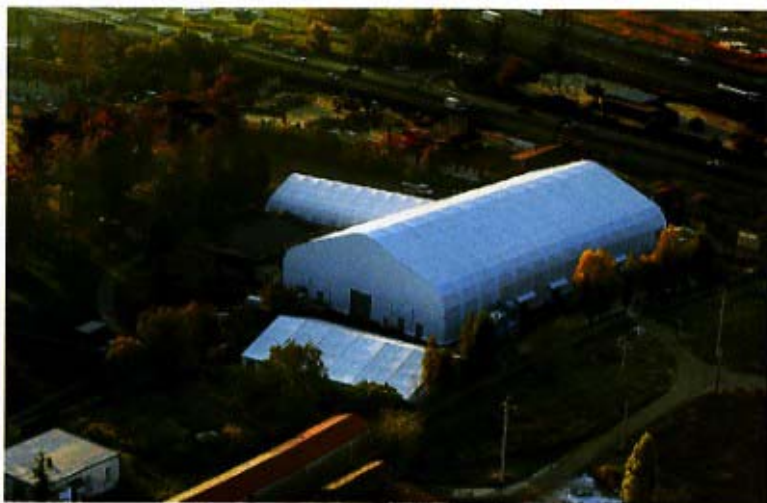
Panoramica aerea del PalaBrescia

La grande struttura offre anche la possibilità di rinfrescarsi nel bel parco secolare e di rifocillarsi nell'annesso ristorante, situato in una delle strutture del complesso di Via San Zeno. Dal punto di vista tecnico, il PalaBrescia è dotato di una sala, calda d'inverno e fresca d'estate grazie al nuovo impianto di climatizzazione, che misura 50 m di lunghezza per 30 m di larghezza (esclusi i corridoi laterali dei bagni, i camerini e il palco). La capienza totale a se-