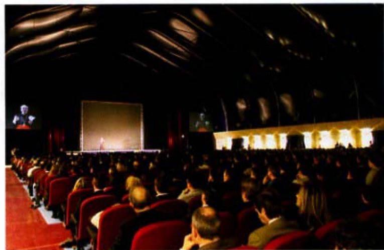
La capiente sala

In particolare oltre agli ormai tradizionali corsi di pattinaggio di avviamento, perfezionamento ed avanzato, ed al progetto scuola, verranno organizzati corsi e tornei di hockey per bambini, corsi e tornei di stock per tutte le età, manifestazioni ed esibizioni di atleti federali.